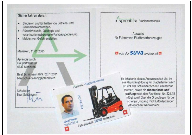
Bild: Unser Ausweis mit dazugehörigem Taschenbatch zum Mitführen.

Wir unterstützen Sie bei der Realisierung der EKAS Richtlinien