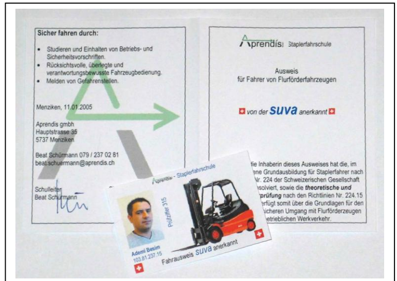
Bild: Unser Ausweis mit dazugehörigem Taschenbatch zum Mitführen.

Wir sind anerkannte Ausbilder für die Weiterbildung von Chauffeuren (CZV) . Wenn die Ausbildung an die Weiterbildungspflicht angerechnet werden soll, muss die Anmeldung mindestens 8 Wochen vor Kursbeginn erfolgen.